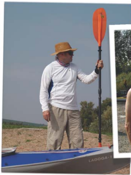
Kurs Nord, 0° Polarkreis ahoi! oder peilt er doch nur die nächste Wirtschaft an?