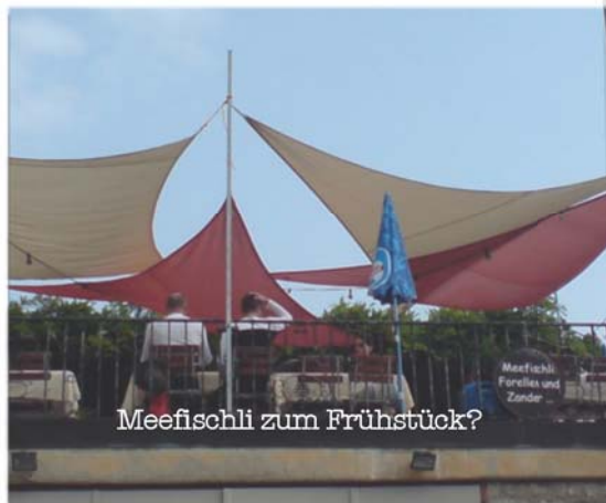
Meefischli zum Frühstück?