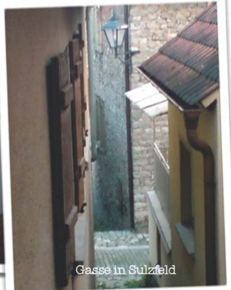
Gasse in Stulzfeld