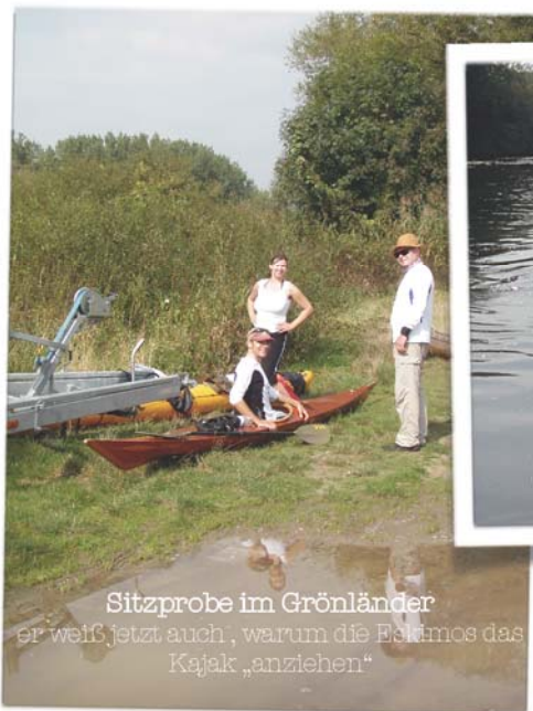
Sitzprobe im Grönländer er weiß jetzt auch, warum die Eskimos das Kajak „anziehen“