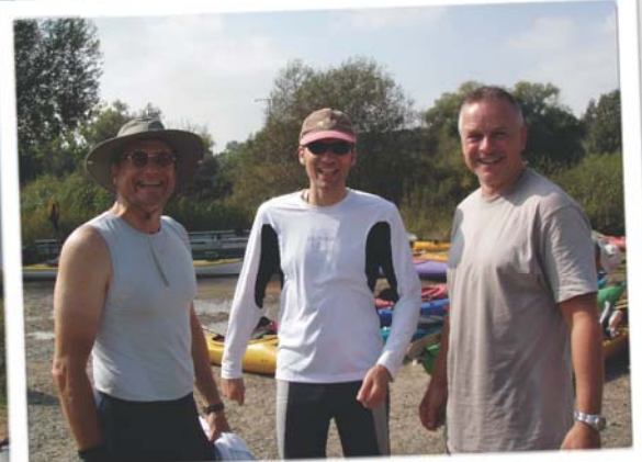
Kuchen gefunden und verspeist, da ist gut lachen