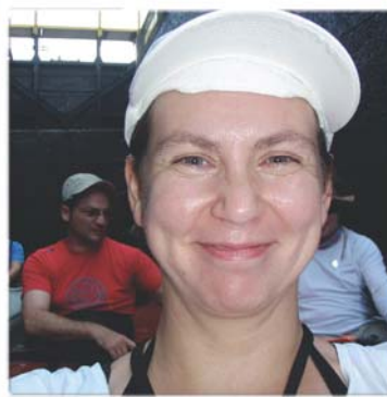
Paddeln macht Freu(n)de!