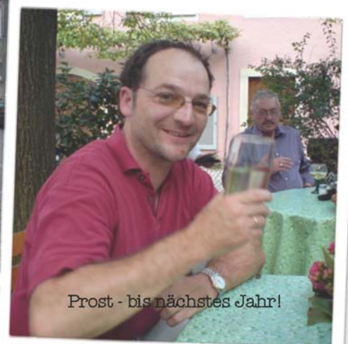
Prost - bis nächstes Jahr!