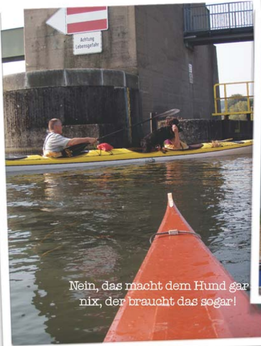
Nein, das macht dem Hund gar nix, der braucht das sogar!