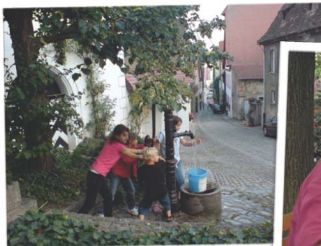
Spaß ohne Gameboy