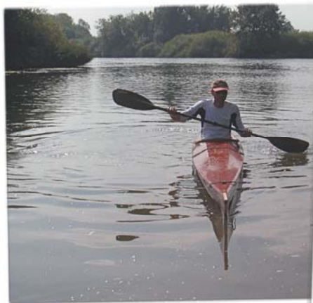
Ergebnis des Kurztests: Fahreigenschaften Top, Beinfreiheit Flop