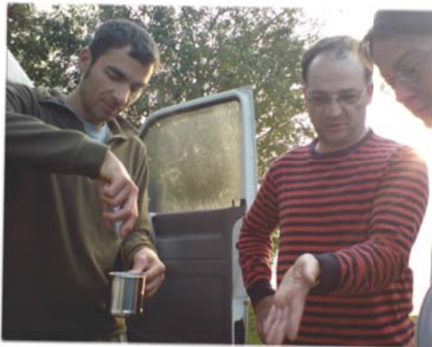
Diskussion über Kaffeekultur