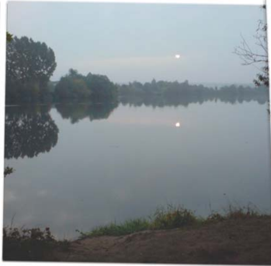
Der Tag wird schön!